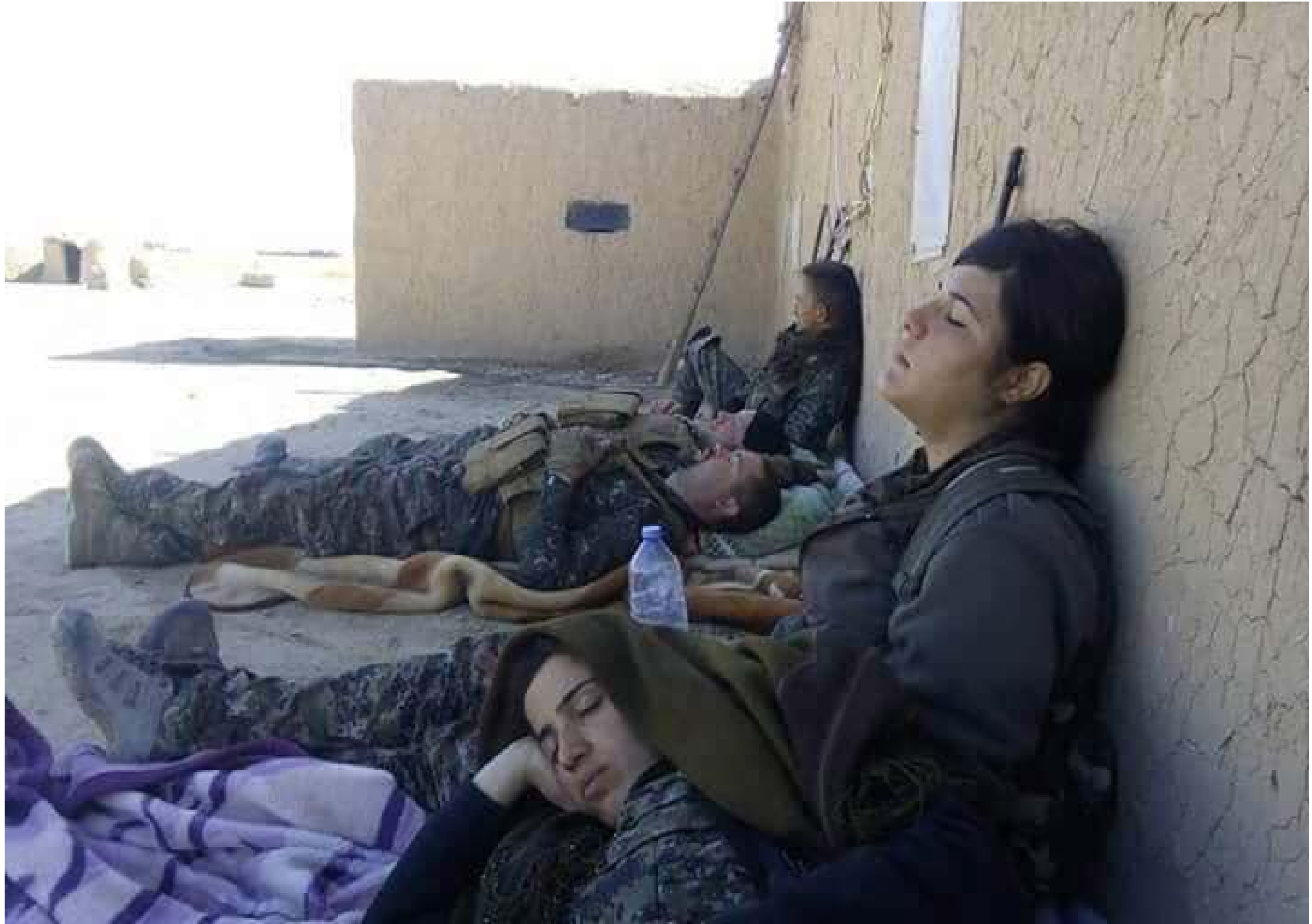
ROJAVA & NORTH EAST SYRIA