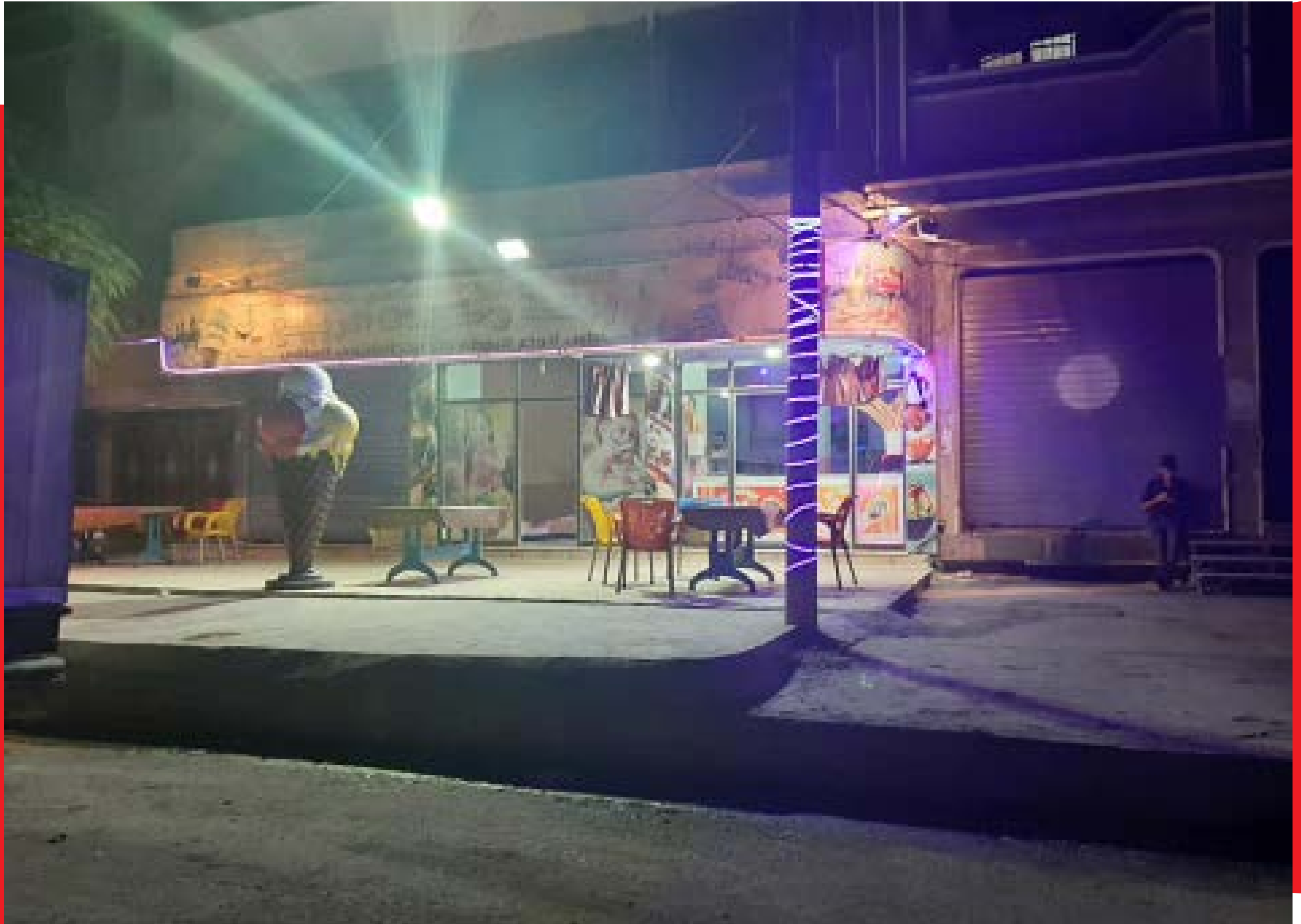
ROJAVA & NORTH EAST SYRIA